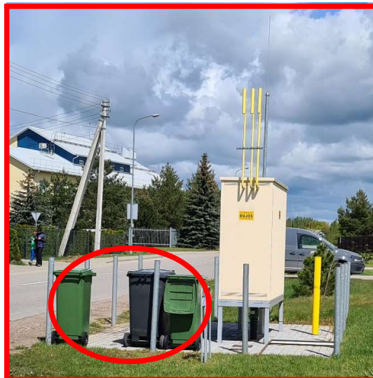
Pašaliniai daiktai DSRĮr aikštelės teritorijoje