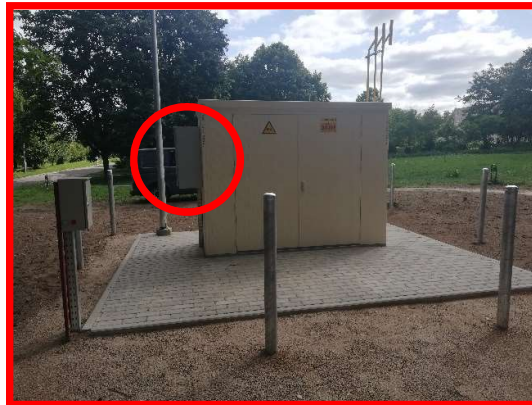
Netinkamai įrengta Micro TSPJ spinta