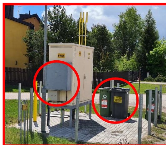
Netinkamai įrengta Micro TSPJ, kabelių spinta ir pašaliniai daiktai DSRĮr aikštelės teritorijoje